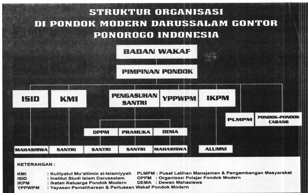
Bagan Struktur Organisasi Pondok Modern Darussalam Gontor Ponorogo 46

Berdasarkan struktur organisasi diatas, YPPWPM (Yayasan Pemeliharaan dan Perluasan Wakaf Pondok Modern) merupakan badan pengelolaan aset dan harta benda wakaf yang didirikan pada 18 Maret 1959. Yayasan atau lembaga ini ditunjuk oleh Badan wakaf untuk